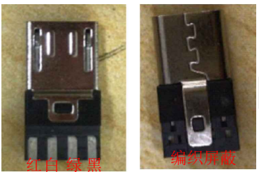
公头线束焊接实物图